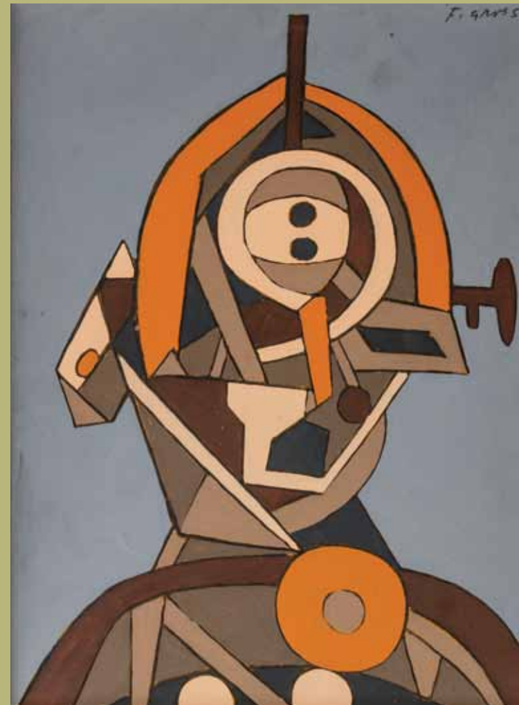
František Gross Hlava I 1972, GMU v Roudnici nad Labem, Foto: Jiří Gordon

Galerie moderního umění v Roudnici nad Labem